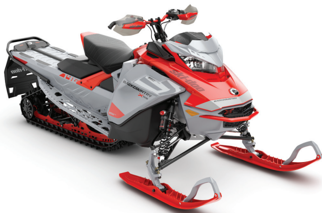
BACKCOUNTRY™ X-RS® 146 850 E-TEC®