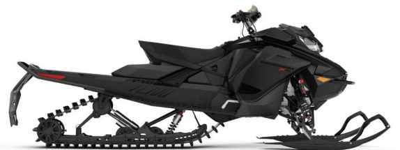
BACKCOUNTRY™ X-RS® 146 850 E-TEC®