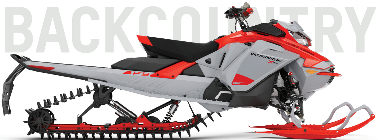
BACKCOUNTRY™ X-RS® 154 850 E-TEC® ТОЛЬКО ВЕСЕННЕЕ ПРЕДЛОЖЕНИЕ