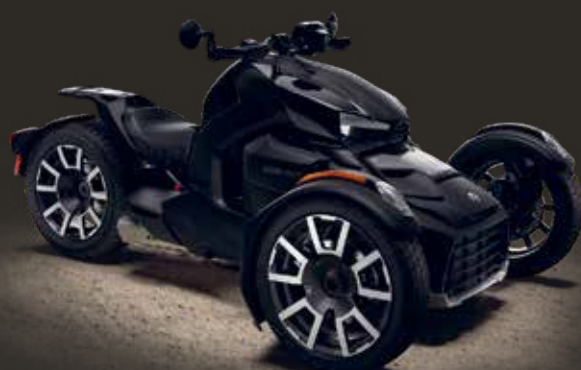
ВЕРСИЯ С ПАНЕЛЯМИ CLASSIC ЧЕРНОГО ЦВЕТА INTENSE BLACK

Выберите один из двух двигателей и оцените идеальное сочетание спокойствия, стабильности и производительности.