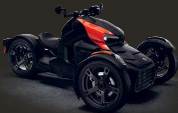
ВЕРСИЯ С ПАНЕЛЯМИ CLASSIC КРАСНОГО ЦВЕТА ADRENALINE RED

ВЫБЕРИТЕ ОДНУ ИЗ ДВУХ МОДЕЛЕЙ CAN-AM RYKER