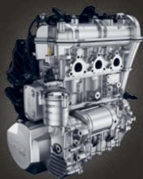
ДВИГАТЕЛЬ ROTAX 900 ACE

Обладая небольшой массой, изготовленный из долговечных перерабатываемых материалов, каждый Can-Am Ryker создан с учетом требований защиты окружающей среды, благодаря чему в вашем распоряжении окажется доступное, качественное и экологичное транспортное средство.